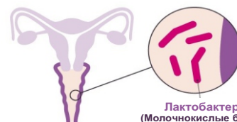
Лактобактерии (Молочнокислые бактерии)

Бактериальный вагиноз, также известный как Gardnerella vaginalis , является одним из наиболее распространенных вагинальных заболеваний (патологий). Примерно одна из трех женщин страдала от этого, по крайней мере, один раз в жизни. Вероятность развития бактериального вагиноза особенно высока у женщин репродуктивного возраста. Различные молочнокислые бактерии, лактобактерии, играют важную роль в создании и поддержании кислой среды во влагалище. Однако есть много факторов, снижающих количество лактобактерий и вызывающих изменение pH во влагалище, таких как: - Приём антибиотиков и/или противозачаточных - Химикаты в бассейне и чрезмерная гигиена - Диабет, гормональные колебания - Стресс и несбалансированное питание - Частая смена половых партнёров